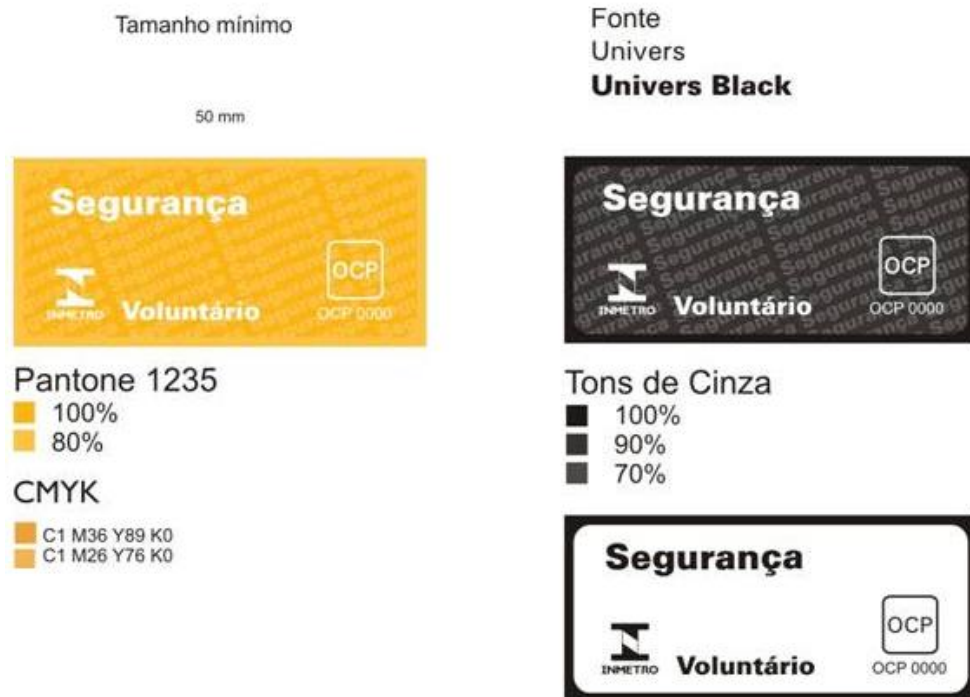
Figura 2 - Selo de Identificação da Conformidade para produtos com certificação voluntária